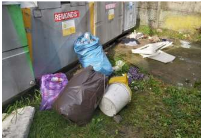
ul. Jana Pawła II