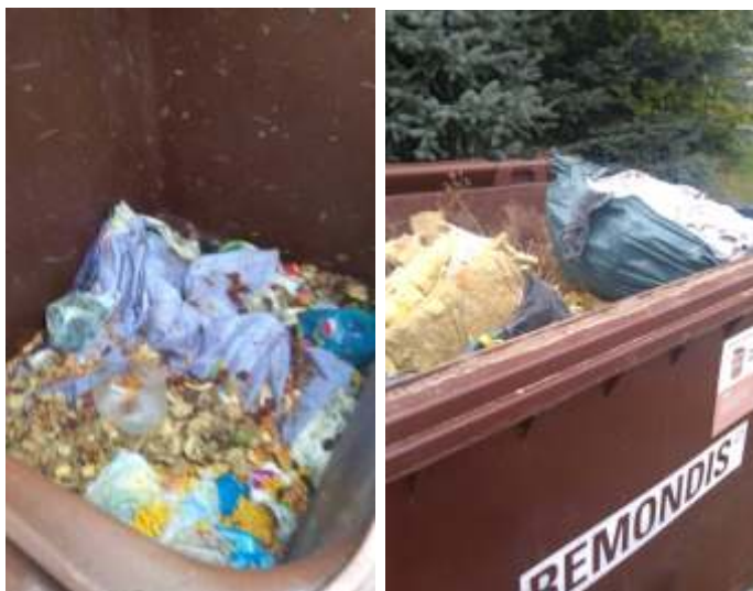
Tak wykorzystujemy worki na bio.