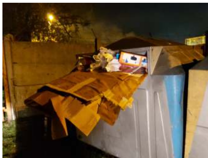
ul. Jana Pawła II

Proszę pomyśleć, ile odpadów można byłoby jeszcze wysegregować. Nasuwa mi się tylko jedno stwierdzenie - bezmyślność. Wszystkie odpady szklane powinny się znaleźć w pojemniku na szkło – kolor zielony; wszystkie odpady z tworzyw sztucznych, pojemniki, reklamówki, doniczki, znicze, sztuczne kwiaty, puszki, metalowe nakrętki od stołków, kartony po mleku, powinny się znaleźć w pojemniku na tworzywa sztuczne - kolor żółty, papiery i tektura w pojemniku na papier i tekturę kolor – niebieski. Proszę zwrócić uwagę na ostatnie zdjęcie. Jak można tak się zachować. Nie dość, że został zablokowany otwór i inni nie mogą korzystać z pojemnika, to papier już się do niczego