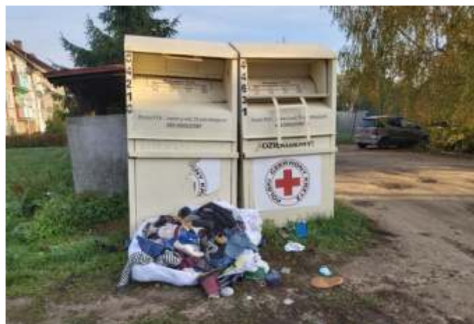
ul. H. Dąbrowskiego